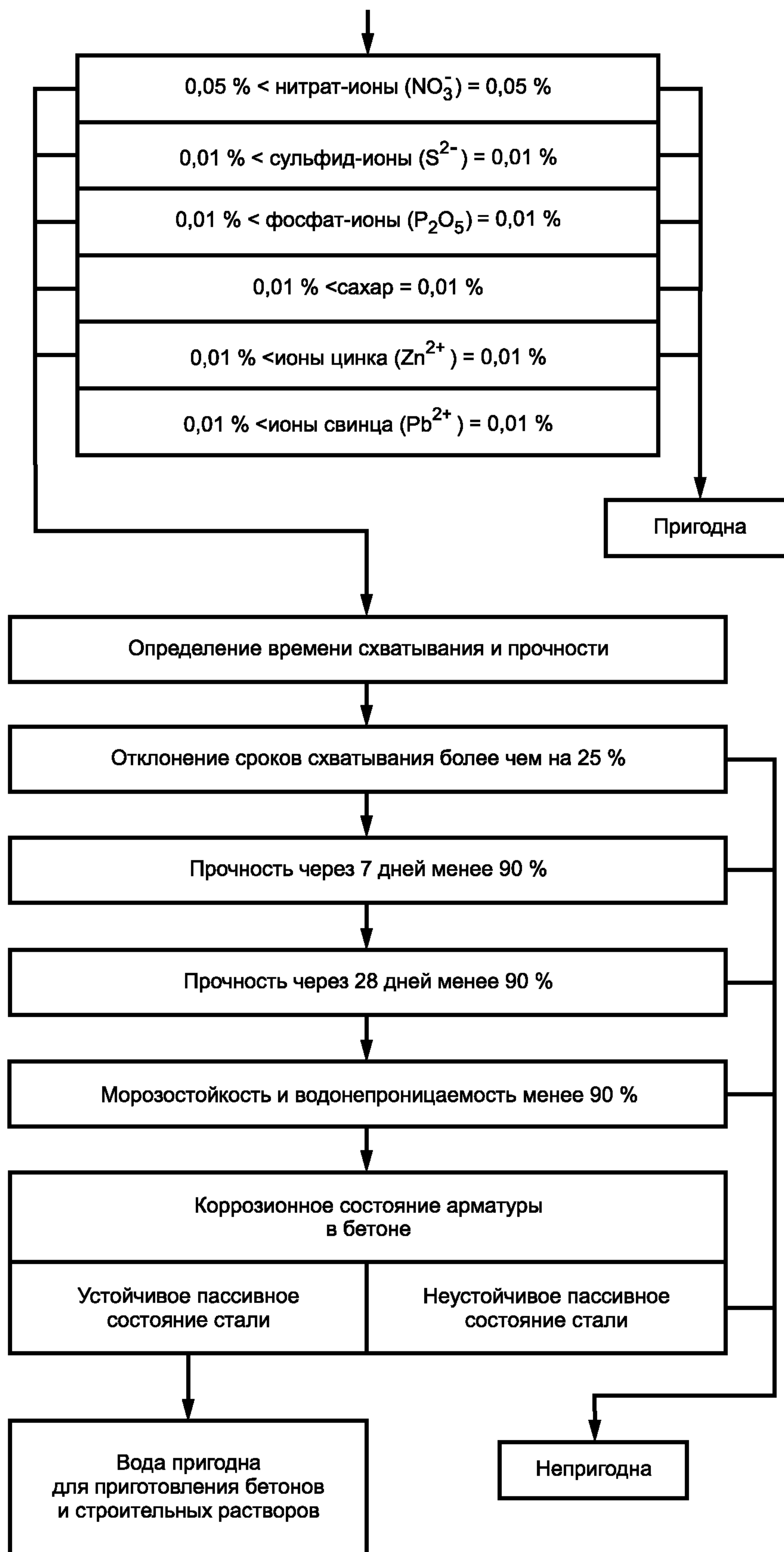
Рисунок А.1 (лист 2)