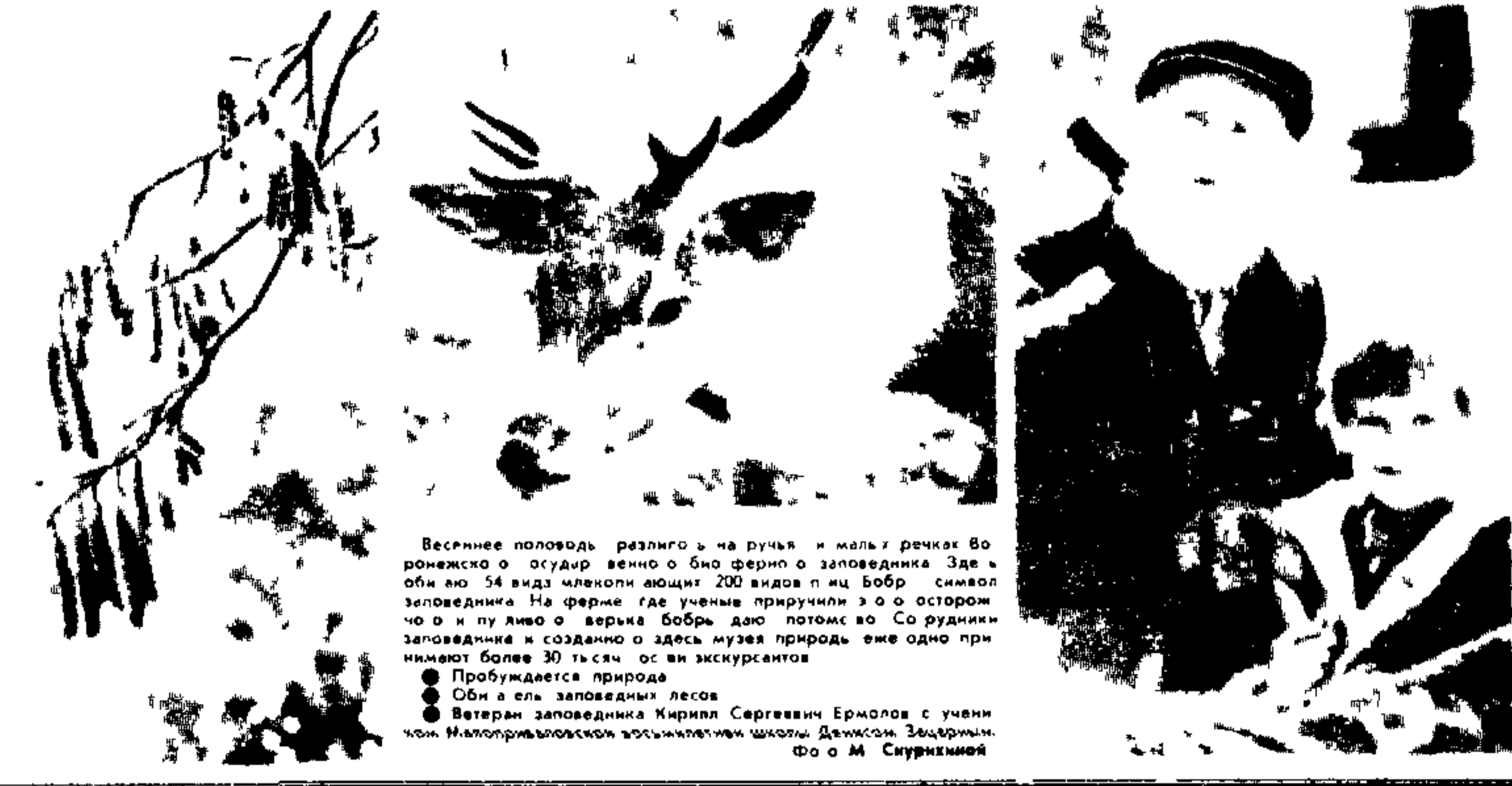
Весеннее половодье разлило с реки в малай река в Воронежской области. В пойме реки обитает много редких видов животных...