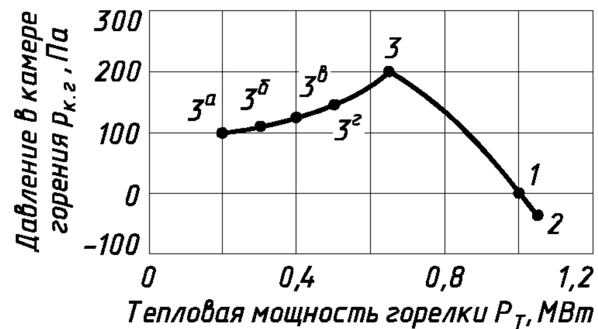
Рисунок А.2 — Пример графического изображения для горелок с многоступенчатым и плавным регулированием тепловой мощности